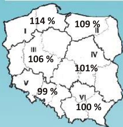
Plonowanie KORMORANA w poszczególnych rejonach Polski w roku 2010. (PDO COBORU)